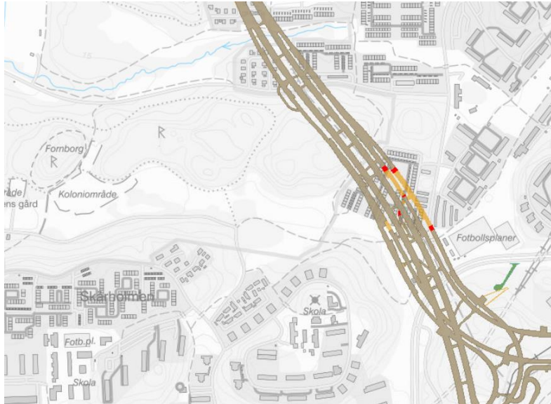
Figur 2. Framdrift av tunnlar inom projektet Förbifart Stockholm, Trafikverket

I byggskedet kan man använda data som skapas av entreprenörernas maskiner, koppla dessa mot BIM-modellen och visa det i hela i ett geografiskt sammanhang för att till exempel visa framdrift av tunnlar.